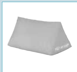
Lejringspuder for optimal støtte